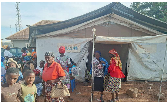
La tenda dell'Unicef, nel campo di Bokkos, è l'unico luogo di istruzione per 300 bambini sfollati